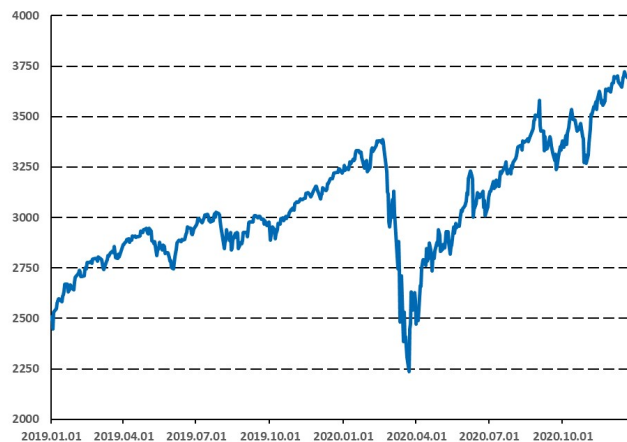
Az S&P 500 index 16%-os emelkedése

Az egyidejű és nagymértékű monetáris és fiskális támogatások gyorsan normalizálni tudták a helyzetet a piacon és így az év hátralevő részében történt eszközáremelkedés minden várakozást felülmúlt. Az S&P 500 és az MSCI feltörekvő piaci indexe 16%-kal magasabban zárta az évet, az amerikai magas kockázatú kötvényindex 6,2%-ot emelkedett, míg az feltörekvő piaci keménydevizás kötvények több mint 5%-os hozamot hoztak.