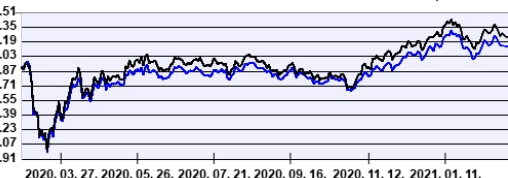
— Aegon Russia Részvény Befektetési Alap HUF sorozat — Benchmark

A múltbeli hozamok nem jelentenek garanciát az alap jövőbeli teljesítményére nézve. Jelen hirdetés nem minősül ajánlattételnek vagy befektetési tanácsadásnak. A befektetés részletes feltételeit az Alap Tájékoztatója tartalmazza, mely a mindenkor érvényes kondíciós listával együtt megtalálható a forgalmazási helyeken. A befektetési alap forgalmazásával (vétel, tartás, eladás) kapcsolatos költségek az alap kezelési szabályzatában és a forgalmazási helyeken megismerhetők.