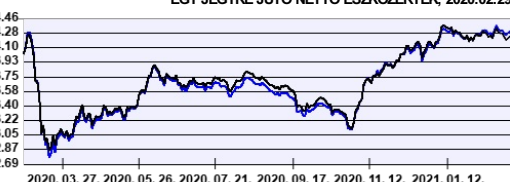
EGY JEGYRE JUTÓ NETTÓ ESZKÖZÉRTÉK, 2020.02.29 - 2021.02.28

A múltbeli hozamok nem jelentenek garanciát az alap jövőbeli teljesítményére nézve. Jelen hirdetés nem minősül ajánlattételnek vagy befektetési tanácsadásnak. A befektetés részletes feltételeit az Alap Tájékoztatója tartalmazza, mely a mindenkor érvényes kondíciós listákkal együtt megtalálható a forgalmazási helyeiken. A befektetés alap forgalmazásával (vétel, tartás, eladás) kapcsolatos költségek az alap kezelési szabályzatában és a forgalmazási helyeiken megismerhetők.