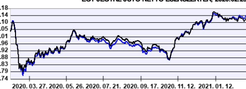
EGY JEGYRE JUTÓ NETTÓ ESZKÖZÉRTÉK, 2020.02.29 - 2021.02.28

— Aegon Közép-Európai Részvény Befektetési Alap CZK sorozat — Benchmark