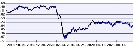
EGY JEGYRE JUTÓ NETTÓ ESZKÖZÉRTÉK, 2019.10.01 - 2020.09.30

A múltbeli hozamok nem jelentenek garanciát az alap jövőbeli teljesítményére nézve. Jelen hirdetés nem minősül ajánlattételnek vagy befektetési tanácsadásnak. A befektetés részletes feltételeit az Alap Tájékoztatója tartalmazza, mely a mindenkor érvényes kondíciós listákkal együtt megtalálható a forgalmazási helyeken. A befektetés alap forgalmazásával (vétel, tartás, eladás) kapcsolatos költségek az alap kezelési szabályzatában és a forgalmazási helyeken megismerhetők.