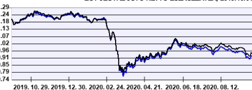
EGY JEGYRE JUTÓ NETTÓ ESZKÖZÉRTÉK, 2019.10.01 - 2020.09.30

— Aegon Közép-Európai Részvény Befektetési Alap CZK sorozat — Benchmark