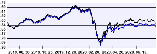
— Aegon Russia Részvény Befektetési Alap HUF sorozat — Benchmark

A múltbeli hozamok nem jelentenek garanciát az alap jövőbeli teljesítményére nézve. Jelen hirdetés nem minősül ajánlattételnek vagy befektetési tanácsadásnak. A befektetés részletes feltételeit az Alap Tájékoztatója tartalmazza, mely a mindenkor érvényes kondíciós listákkal együtt megtalálható a forgalmazási helyeken. A befektetési alap forgalmazásával (vétel, tartás, eladás) kapcsolatos költségek az alap kezelési szabályzatában és a forgalmazási helyeken megismerhetők.