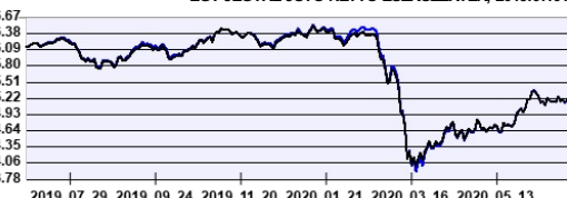
EGY JEGYRE JUTÓ NETTÓ ESZKÖZÉRTÉK, 2019.07.01 - 2020.06.30

Az alábbi hozamok nem jelentenek garanciát az alap jövőbeli teljesítményére nézve. Jelen hirdetés nem minősül ajánlattételnek vagy befektetési tanácsadásnak. A befektetés részletes feltételeit az Alap Tájékoztatója tartalmazza, mely a mindenkor érvényes kondíciós listákkal együtt megtalálható a forgalmazási helyeken. A befektetés alap forgalmazásával (vétel, tartás, eladás) kapcsolatos költségek az alap kezelési szabályzatában és a forgalmazási helyeken megismerhetők.