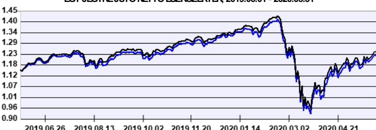
EGYJEGYRE JUTÓ NETTÓ ESZKÖZÉRTÉK, 2019.06.01 - 2020.05.31

----- Aegon Nemzetközi Részvény Befektetési Alap EUR sorozat ----- Benchmark