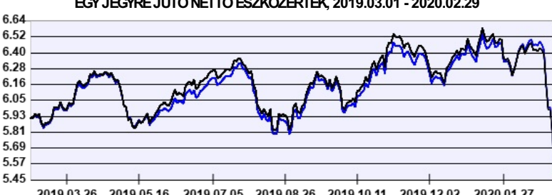
EGY JEGYRE JUTÓ NETTÓ ESZKÖZÉRTÉK, 2019.03.01 - 2020.02.29

— Aegon Közép-Európai Részvény Befektetési Alap intézményi sorozat — Benchmark