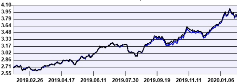
EGY JEGYRE JUTÓ NETTÓ ESZKÖZÉRTÉK, 2019.02.01 - 2020.01.31

----- Aegon Russia Részvény Befektetési Alap intézményi sorozat ----- Benchmark