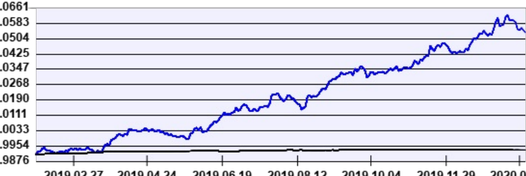
EGY JEGYRE JUTÓ NETTÓ ESZKÖZÉRTÉK, 2019.02.01 - 2020.01.31

A múltbeli hozamok nem jelentenek garanciát az alap jövőbeli teljesítményére nézve. Jelen hirdetés nem minősül ajánlattételnek vagy befektetési tanácsadásnak. A befektetés részletes feltételeit az Alap Tájékoztatója tartalmazza, mely a mindenkor érvényes kondíciós listákkal együtt megtalálható a forgalmazási helyeken. A befektetési alap forgalmazásával (vétel, tartás, eladás) kapcsolatos költségek az alap kezelési szabályzatában és a forgalmazási helyeken megismerhetők.