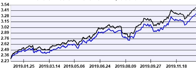
EGY JEGYRE JUTÓ NETTÓ ESZKÖZÉRTÉK, 2019.01.01 - 2019.12.31

A múltbeli hozamok nem jelentenek garanciát az alap jövőbeli teljesítményére nézve. Jelen hirdetés nem minősül ajánlattételnek vagy befektetési tanácsadásnak. A befektetés részletes feltételeit az Alap Tájékoztatója tartalmazza, mely a mindenkor érvényes kondíciós listákkal együtt megtalálható a forgalmazási helyeken. A befektetési alap forgalmazásával (vétel, tartás, eladás) kapcsolatos költségek az alap kezelési szabályzatában és a forgalmazási helyeken megismerhetők.