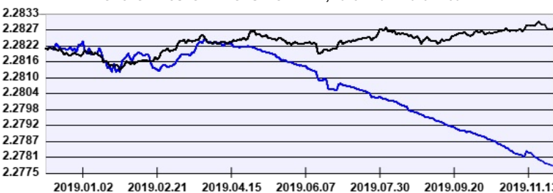
EGY JEGYRE JUTÓ NETTÓ ESZKÖZÉRTÉK 2018.12.01 - 2019.11.30

----- Agon Pénzpiaci Befektetési Alap HUF sorozat ----- Benchmark