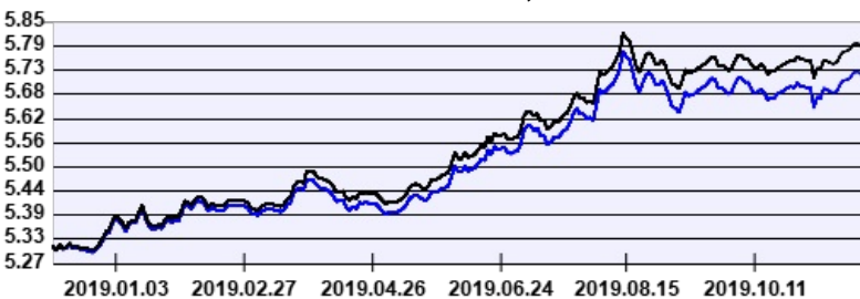
EGY JEGYRE JUTÓ NETTÓ ESZKÖZÉRTÉK, 2018.12.01 - 2019.11.30

— Aegon Belföldi Kötvény Befektetési Alap HUF sorozat — Benchmark