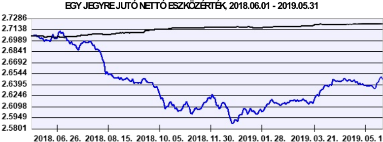
EGY JEGYRE JUTÓ NETTÓ ESZKÖZÉRTÉK, 2018.06.01 - 2019.05.31

----- Aegon Alfa Abszolút Hozamú Befektetési Alap HUF sorozat ----- Benchmark