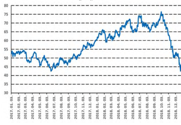
40%-os esés az olajárban