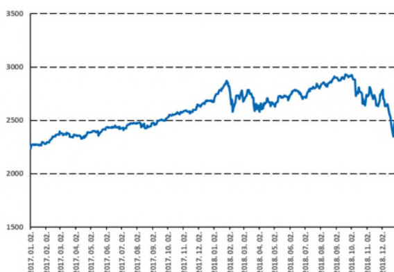
Éves mélypontra az S&P 500

A 2018-as év fordulópontját az októberi hónap jelentette, hiszen nagymértékű piaci visszaesésnek lehettünk szemtanúi nem csak az olajpiacon de az amerikai részvényt piacon is. Az olajár az egészen októberig tartó emelkedést követően az újra felbukkanó kínálati és a növekedési félelmek miatti keresleti aggodalmak miatt összeomlottak és így csupán a negyedik negyedévben közel 40%-ot esett a WTI árfolyama. Az amerikai részvények 14%-kal estek, alulteljesítve ezzel hosszú idő után először a legtöbb régiót. Az amerikai részvények kivételével a főbb eszközosztályoknak az októberi visszaesés talán csak a legzajosabb időszaka volt az évnél, egy egész éves esést betetőzve. A részvényt piacok Európában, Japánban, az Egyesült Királyságban és Kínában is gyengén teljesítettek mielőtt az amerikai részvényekkel párhuzamosan tovább estek volna októberben. A romló növekedési kilátások, zuhanó részvényt piacok és a csökkenő olajárak nyomán a fejlett piaci kötvényhozamok erőteljes csökkenésbe kezdtek és mind az amerikai 10 éves, mind pedig a német hozamok az év elejéhez képest a legalacsonyabb szinteken zárták az évet.