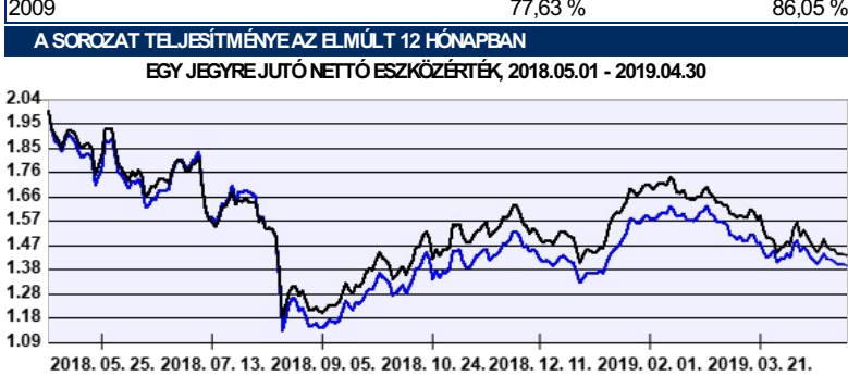
EGY JEGYRE JUTÓ NETTÓ ESZKÖZÉRTÉK, 2018.05.01 - 2019.04.30

----- Aegon IstanBull Részvény Befektetési Alap HUF sorozat ----- Benchmark