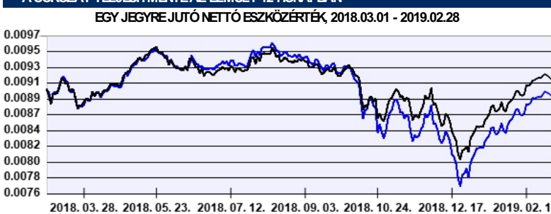
EGY JEGYRE JUTÓ NETTÓ ESZKÖZÉRTÉK, 2018.03.01 - 2019.02.28

----- Aegon MegaTrend Részvény Befektetési Alapok Alapja EUR sorozat ----- Benchmark A múltbeli hozamok nem jelentenek garanciát az alap jövőbeli teljesítményére nézve. Jelen hirdetés nem minősül ajánlattételnek vagy befektetési tanácsadásnak. A befektetés részletes feltételeit az Alap Tájékoztatója tartalmazza, mely a mindenkor érvényes kondíciós listákkal együtt megtalálható a forgalmazási helyeken. A befektetési alap forgalmazásával (vétel, tartás, eladás) kapcsolatos költségek az alap kezelési szabályzatában és a forgalmazási helyeken megismerhetők.