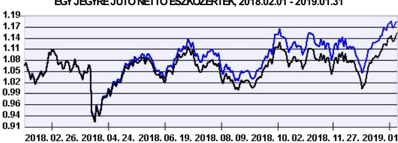
EGY JEGYRE JUTÓ NETTÓ ESZKÖZÉRTÉK, 2018.02.01 - 2019.01.31

— Aegon Russia Részvény Befektetési Alap PLN sorozat — Benchmark A múltbeli hozamok nem jelentenek garanciát az alap jövőbeni teljesítményére nézve. Jelen hirdetés nem minősül ajánlattételnek vagy befektetési tanácsadásnak. A befektetés részletes feltételeit az Alap Tájékoztatója tartalmazza, mely a mindenkor érvényes kondíciós listával együtt megtalálható a forgalmazási helyeken. A befektetési alap forgalmazásával (vétel, tartás, eladás) kapcsolatos költségek az alap kezelési szabályzatában és a forgalmazási helyeken megismerhetők.