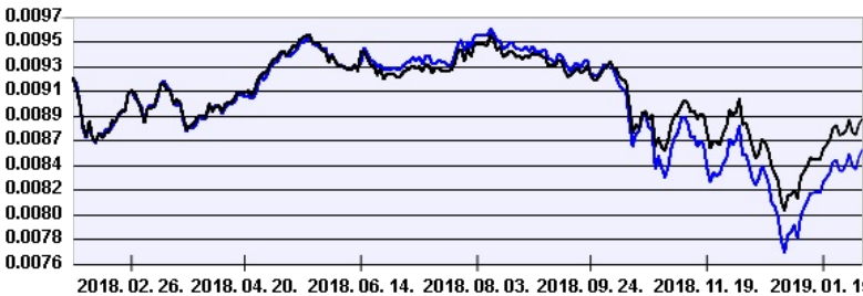
EGYJEGYREJUTÓ NETTÓ ESZKÖZÉRTÉK, 2018.02.01 - 2019.01.31

----- Aegon MegaTrend Részvény Befektetési Alapok Alapja EUR sorozat ----- Benchmark A múltbeli hozamok nem jelentenek garanciát az alap jövőbeli teljesítményére nézve. Jelen hirdetés nem minősül ajánlattételnek vagy befektetési tanácsadásnak. A befektetés részletes feltételeit az Alap Tájékoztatója tartalmazza, mely a mindenkor érvényes kondíciós listákkal együtt megtalálható a forgalmazási helyeken. A befektetési alap forgalmazásával (vétel, tartás, eladás) kapcsolatos költségek az alap kezelési szabályzatában és a forgalmazási helyeken megismerhetők.