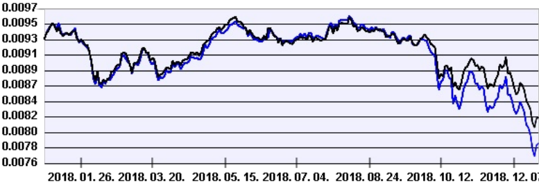
EGY JEGYRE JUTÓ NETTÓ ESZKÖZÉRTÉK, 2018.01.01 - 2018.12.31

----- Aegon MegaTrend Részvény Befektetési Alapok Alapja EUR sorozat ----- Benchmark A múltbeli hozamok nem jelentenek garanciát az alap jövőbeli teljesítményére nézve. Jelen hirdetés nem minősül ajánlattételnek vagy befektetési tanácsadásnak. A befektetés részletes feltételeit az Alap Tájékoztatója tartalmazza, mely a mindenkor érvényes kondíciós listákkal együtt megtalálható a forgalmazási helyeken. A befektetési alap forgalmazásával (vétel, tartás, eladás) kapcsolatos költségek az alap kezelési szabályzatában és a forgalmazási helyeken megismerhetők.