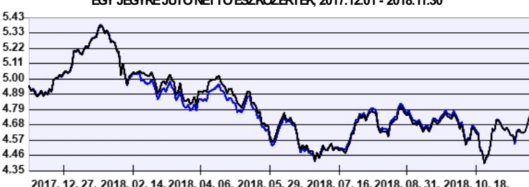
EGY JEGYRE JUTÓ NETTÓ ESZKÖZÉRTÉK, 2017.12.01 - 2018.11.30

----- Aegon Közép-Európai Részvény Befektetési Alap EUR sorozat ----- Benchmark