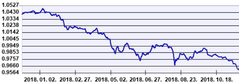
— Aegon Feltörekvő Európa Kötvény Befektetési Alap EUR sorozat

A múltbéli hozamok nem jelentenek garanciát az alap jövőbeli teljesítményére nézve. Jelen hirdetés nem minősül ajánlattételnek vagy befektetési tanácsadásnak. A befektetés részletes feltételeit az Alap Tájékoztatója tartalmazza, mely a mindenkor érvényes kondíciós listával együtt megtalálható az forgalmazási helyeken. A befektetési alap forgalmazásával (vétel, tartás, eladás) kapcsolatos költségek az alap kezelési szabályzatában és a forgalmazási helyeken megismerhetők.