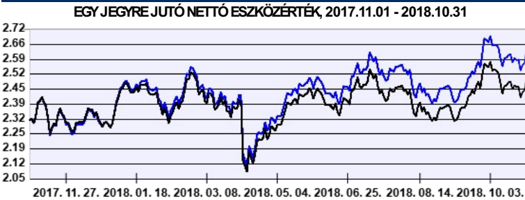
EGY JEGYRE JUTÓ NETTÓ ESZKÖZÉRTÉK, 2017.11.01 - 2018.10.31

— Aegon Russia Részvény Befektetési Alap intézményi sorozat — Benchmark