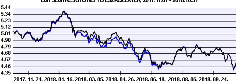
EGY JEGYRE JUTÓ NETTÓ ESZKÖZÉRTÉK, 2017.11.01 - 2018.10.31

--- Aegon Közép-Európai Részvény Befektetési Alap EUR sorozat --- Benchmark