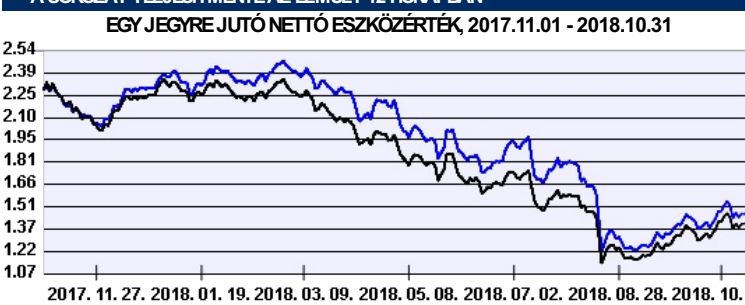
EGY JEGYRE JUTÓ NETTÓ ESZKÖZÉRTÉK, 2017.11.01 - 2018.10.31

A múltbeli hozamok nem jelentenek garanciát az alap jövőbeli teljesítményére nézve. Jelen hirdetés nem minősül ajánlattételnek vagy befektetési tanácsadásnak. A befektetés részletes feltételeit az Alap Tájékoztatója tartalmazza, mely a mindenkor érvényes kondíciós listákkal együtt megtalálható a forgalmazási helyeken. A befektetési alap forgalmazásával (vétel, tartás, eladás) kapcsolatos költségek az alap kezelési szabályzatában és a forgalmazási helyeken megismerhetők.