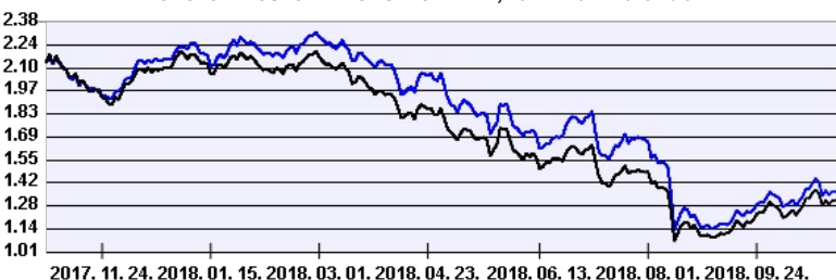
EGY JEGYRE JUTÓ NETTÓ ESZKÖZÉRTÉK, 2017.11.01 - 2018.10.31

----- Aegon IstanBull Részvény Befektetési Alap HUF sorozat ----- Benchmark