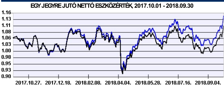
EGY JEGYRE JUTÓ NETTÓ ESZKÖZÉRTÉK, 2017.10.01 - 2018.09.30

— Aegon Russia Részvény Befektetési Alap PLN sorozat — Benchmark