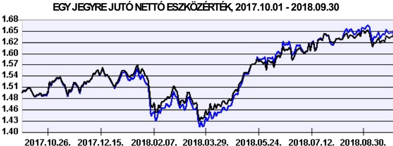
EGY JEGYRE JUTÓ NETTÓ ESZKÖZÉRTÉK, 2017.10.01 - 2018.09.30