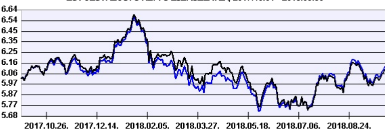
EGY JEGYRE JUTÓ NETTÓ ESZKÖZÉRTÉK, 2017.10.01 - 2018.09.30

---- Aegon Közép-Európai Részvény Befektetési Alap intézményi sorozat