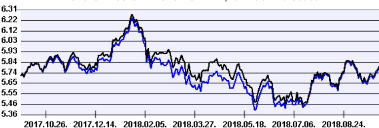
EGY JEGYRE JUTÓ NETTÓ ESZKÖZÉRTÉK, 2017.10.01 - 2018.09.30