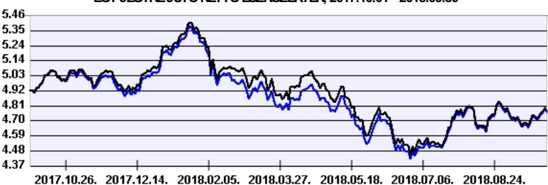
EGY JEGYRE JUTÓ NETTÓ ESZKÖZÉRTÉK, 2017.10.01 - 2018.09.30

--- Aegon Közép-Európai Részvény Befektetési Alap EUR sorozat --- Benchmark A múltbeli hozamok nem jelentenek garanciát az alap jövőbeli teljesítményére nézve. Jelen hirdetés nem minősül ajánlattételnek vagy befektetési tanácsadásnak. A befektetés részletes feltételeit az Alap Tájékoztatója tartalmazza, mely a mindenkor érvényes kondíciós listákkal együtt megtalálható a forgalmazási helyeken. A befektetési alap forgalmazásával (vétel, tartás, eladás) kapcsolatos költségek az alap kezelési szabályzatában és a forgalmazási helyeken megismerhetők.