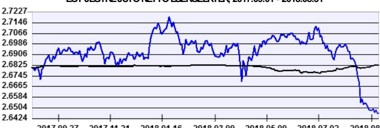
EGY JEGYRE JUTÓ NETTÓ ESZKÖZÉRTÉK, 2017.09.01 - 2018.08.31

----- Aegon Alfa Abszolút Hozamú Befektetési Alap HUF sorozat ----- Benchmark