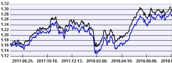
EGY JEGYRE JUTÓ NETTÓ ESZKÖZÉRTÉK, 2017.08.01 - 2018.07.31

----- Aegon Climate Change Részvény Befektetési Alap HUF sorozat ----- Benchmark A múltbeli hozamok nem jelentenek garanciát az alap jövőbeli teljesítményére nézve. Jelen hirdetés nem minősül ajánlattételnek vagy befektetési tanácsadásnak. A befektetés részletes feltételeit az Alap Tájékoztatója tartalmazza, mely a mindenkor érvényes kondíciós listákkal együtt megtalálható a forgalmazási helyeken. A befektetési alap forgalmazásával (vétel, tartás, eladás) kapcsolatos költségek az alap kezelési szabályzatában és a forgalmazási helyeken megismerhetők.