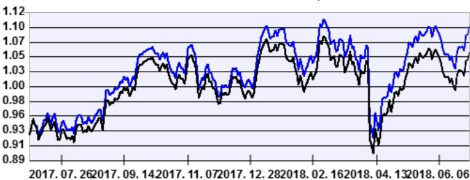
EGY JEGYRE JUTÓ NETTÓ ESZKÖZÉRTÉK, 2017.07.01 - 2018.06.30

----- Aegon Russia Részvény Befektetési Alap PLN sorozat ----- Benchmark