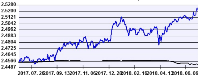
EGY JEGYRE JUTÓ NETTÓ ESZKÖZÉRTÉK, 2017.07.01 - 2018.06.30

----- Aegon Alfa Abszolút Hozamú Befektetési Alap PLN sorozat ----- Benchmark