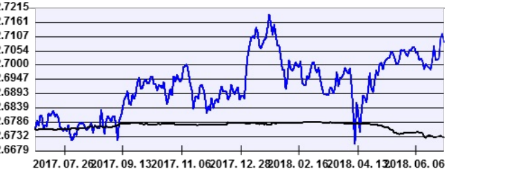
AZ ALAP TELJESÍTMÉNYE AZ ELMŰLT 12 HÓNAPBAN EGY JEGYRE JUTÓ NETTÓ ESZKÖZÉRTÉK, 2017.07.01 - 2018.06.30

----- Aegon Alfa Abszolút Hozamú Befektetési Alap HUF sorozat ----- Benchmark A múltbeli hozamok nem jelentenek garanciát az alap jövőbeli teljesítményére nézve. Jelen hirdetés nem minősül ajánlattételnek vagy befektetési tanácsadásnak. A befektetés részletes feltételeit az Alap Tájékoztatója tartalmazza, mely a mindenkor érvényes kondíciós listákkal együtt megtalálható a forgalmazási helyeken. A befektetési alap forgalmazásával (vétel, tartás, eladás) kapcsolatos költségek az alap kezelési szabályzatában és a forgalmazási helyeken megismerhetők.