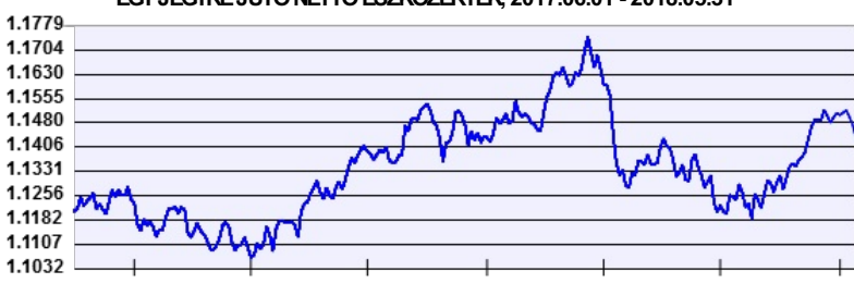
— Aegon Tempó Allegro 9 Alapokba Fektető Részalap

A múltbeli hozamok nem jelentenek garanciát az alap jövőbeli teljesítményére nézve. Jelen hirdetés nem minősül ajánlattételnek vagy befektetési tanácsadásnak. A befektetés részletes feltételeit az Alap Tájékoztatója tartalmazza, mely a mindenkor érvényes kondíciós listákkal együtt megtalálható a forgalmazási helyeken. A befektetési alap forgalmazásával (vétel, tartás, eladás) kapcsolatos költségek az alap kezelési szabályzatában és a forgalmazási helyeken megismerhetők.