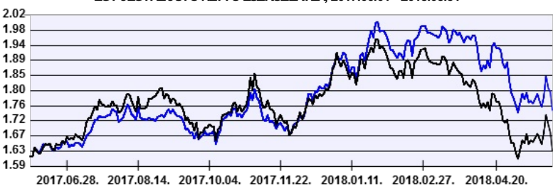
EGY JEGYRE JUTÓ NETTÓ ESZKÖZÉRTÉK, 2017.06.01 - 2018.05.31

----- Aegon IstanBull Részvény Befektetési Alap TRY sorozat ----- Benchmark