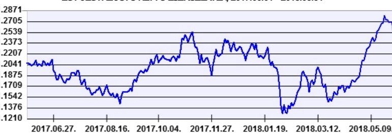
EGY JEGYRE JUTÓ NETTÓ ESZKÖZÉRTÉK, 2017.06.01 - 2018.05.31

----- Aegon Climate Change Részvény Befektetési Alap HUF sorozat ----- Benchmark A múltbeli hozamok nem jelentenek garanciát az alap jövőbeli teljesítményére nézve. Jelen hirdetés nem minősül ajánlattételnek vagy befektetési tanácsadásnak. A befektetés részletes feltételeit az Alap Tájékoztatója tartalmazza, mely a mindenkor érvényes kondíciós listákkal együtt megtalálható a forgalmazási helyeken. A befektetési alap forgalmazásával (vétel, tartás, eladás) kapcsolatos költségek az alap kezelési szabályzatában és a forgalmazási helyeken megismerhetők.