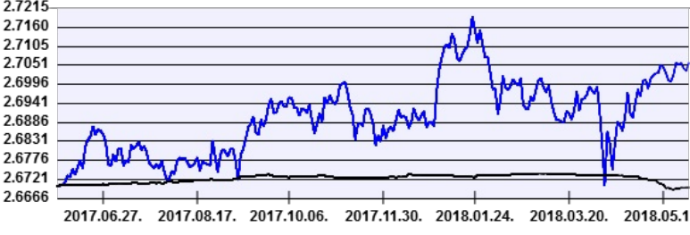
EGY JEGYRE JUTÓ NETTÓ ESZKÖZÉRTÉK, 2017.06.01 - 2018.05.31

----- Aegon Alfa Abszolút Hozamú Befektetési Alap HUF sorozat ----- Benchmark