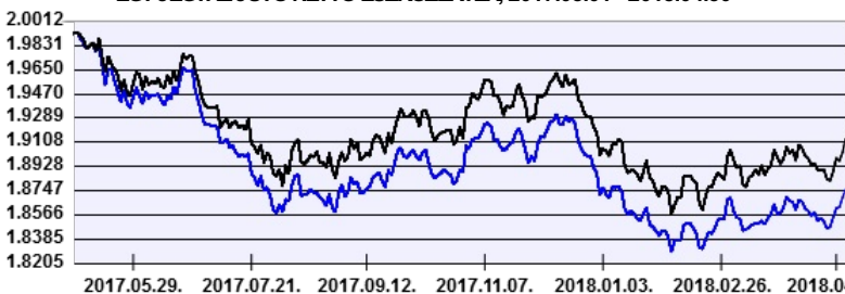
EGY JEGYRE JUTÓ NETTÓ ESZKÖZÉRTÉK, 2017.05.01 - 2018.04.30

— Aegon Nemzetközi Kötvény Befektetési Alap — Benchmark