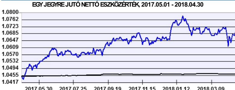
EGY JEGYRE JUTÓ NETTÓ ESZKÖZÉRTÉK, 2017.05.01 - 2018.04.30