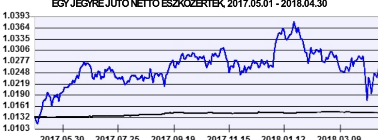
— Aegon Alfa Abszolút Hozamú Befektetési Alap EUR sorozat — Benchmark

A múltbeli hozamok nem jelentenek garanciát az alap jövőbeni teljesítményére nézve. Jelen hirdetés nem minősül ajánlattételnek vagy befektetési tanácsadásnak. A befektetés részletes feltételeit az Alap Tájékoztatója tartalmazza, mely a mindenkor érvényes kondíciós listával együtt megtalálható a forgalmazási helyeken. A befektetési alap forgalmazásával (vétel, tartás, eladás) kapcsolatos költségek az alap kezelési szabályzatában és a forgalmazási helyeken megismerhetők.