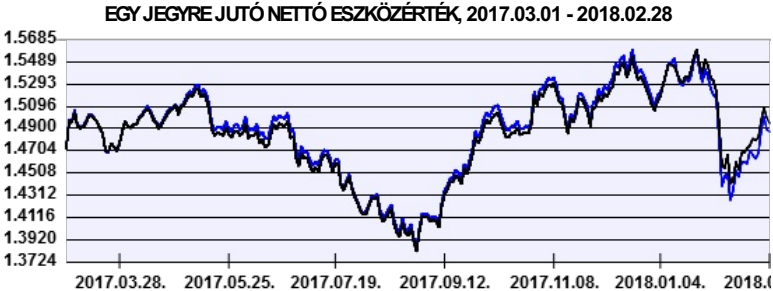
EGY JEGYRE JUTÓ NETTÓ ESZKÖZÉRTÉK, 2017.03.01 - 2018.02.28