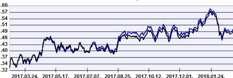
EGY JEGYRE JUTÓ NETTÓ ESZKÖZÉRTÉK, 2017.03.01 - 2018.02.28

----- Aegon Lengyel Részvény Befektetési Alap HUF sorozat ----- Benchmark