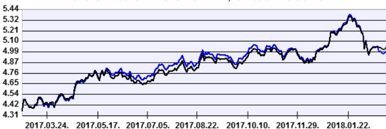
EGY JEGYRE JUTÓ NETTÓ ESZKÖZÉRTÉK, 2017.03.01 - 2018.02.28

--- Aegon Közép-Európai Részvény Befektetési Alap EUR sorozat --- Benchmark