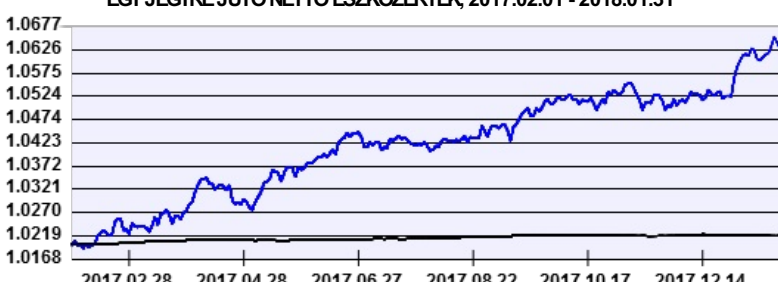
— Aegon Alfa Abszolút Hozamú Befektetési Alap USD sorozat — Benchmark

A múltbeli hozamok nem jelentenek garanciát az alap jövőbeni teljesítményére nézve. Jelen hirdetés nem minősül ajánlattételnek vagy befektetési tanácsadásnak. A befektetés részletes feltételeit az Alap Tájékoztatója tartalmazza, mely a mindenkor érvényes kondíciós listákkal együtt megtalálható a forgalmazási helyeken. A befektetési alap forgalmazásával (vétel, tartás, eladás) kapcsolatos költségek az alap kezelési szabályzatában és a forgalmazási helyeken megismerhetők.