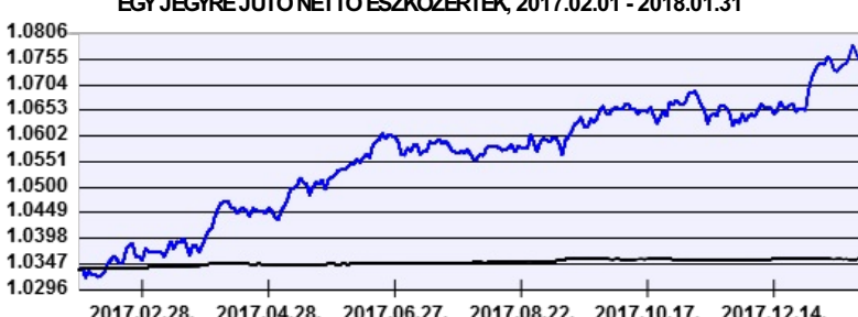
EGY JEGYRE JUTÓ NETTÓ ESZKÖZÉRTÉK, 2017.02.01 - 2018.01.31